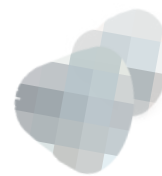
LED de Reemplazo LXG