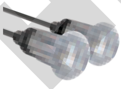
Reflector AURA LED