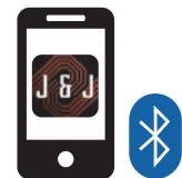
Conexión mediante Bluetooth

Búscala como "ColorSplash XG Controller"